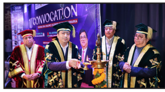
ट्रिनिटी द्वारका के 10 वें वीक्षांत समारोह में छात्रों को मिली डिग्री, इंडस्ट्री के लिए हुए रेडी