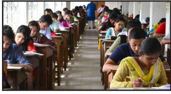
IP University Conducted Odd Semester Exams in January